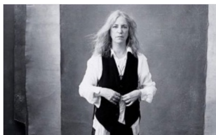
Des femmes seniors dans l'édition 2016 du Calendrier Pirelli