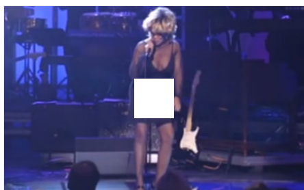
Tina Turner fête ses 76 ans avec une pêche incroyable !