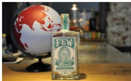
Le Gin dans tous ses états