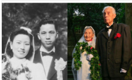
La même photo de mariage... 70 après